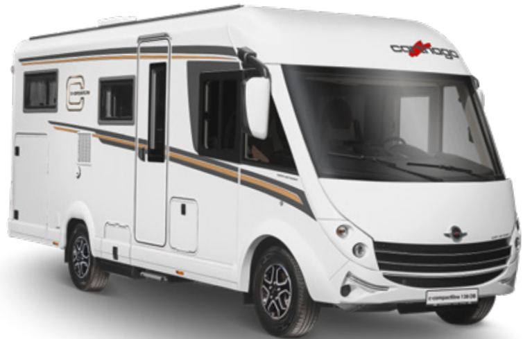
Modell: c-compactline I 138 DB*