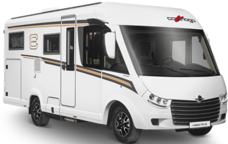
Modell: c-tourer I 141 LE*

Der anspruchsvolle Alleskönner – Lightweight-Modelle praxistauglich für die Anforderung in der 3,5-t-Gewichtsklasse!